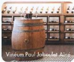
Vinéum Paul Jaboulet Aîné

Première étape : la Cité du chocolat (12, avenue du Président Roosevelt, Tél. : 04 75 09 27 27). Le parcours muséographique suit le processus de fabrication du chocolat. On peut également participer à des mini-ateliers : dégustation commentée, ouverture d'une cabosse, tour de